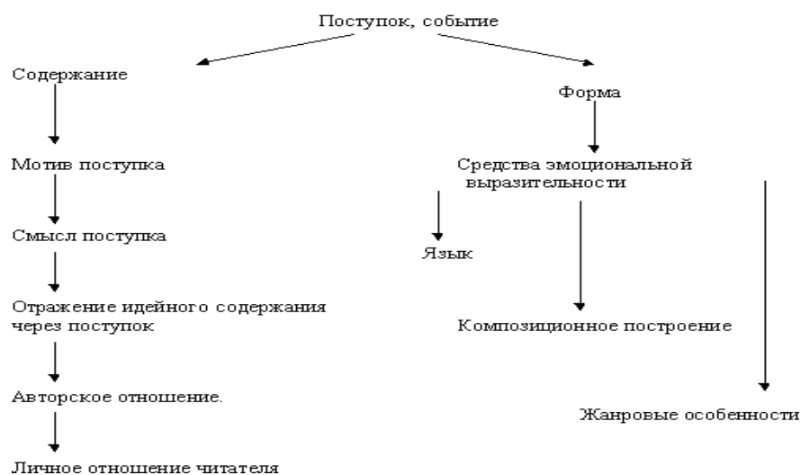
СХЕМА АНАЛИЗА ПОСТУПКА ПЕРСОНАЖА